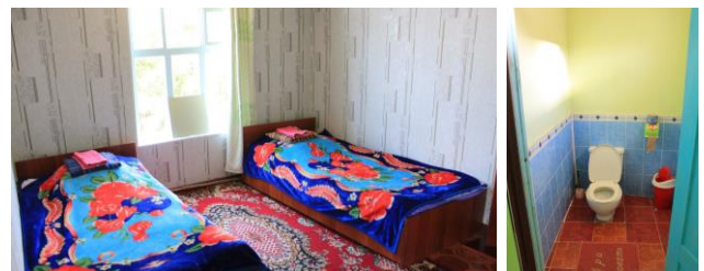
Beispiel einfacher Unterkunft in Kirgistan

Für die Gruppe wurden, wo vorhanden, 4*-Hotels reserviert, ansonsten die jeweils qualitativ beste Unterkunftsmöglichkeit. In Usbekistan sind die Unterkünfte auf einem guten Niveau, meistens mit westlichem Standard vergleichbar. In Kirgistan gibt es in abgelegenen Gebieten nur wenige Unterkunftsmöglichkeiten, eine interessante Reiseroute ist daher nur möglich mit Komforteinbussen. Die Unterkünfte sind dort einfacher, teilweise mit Toiletten auf dem Gang. Ein voller Hotelservice kann nicht immer erwartet werden. Speziell zu erwähnen sind die Übernachtungen in Kok Bel und in Bokonbaev. In Kok Bel ist die Übernachtung in einem Gasthaus vorgesehen. In Bokonbaevo am Issyk Kul wird in einem Jurtencamp übernachtet. In beiden Orten hat es jeweils ein Gemeinschaftsbad mit fliessendem Wasser. Die Jurten werden jeweils mit 2-4 Gäste der Gruppe geteilt.